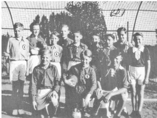
Handball-Jugendmannschaft des Turn-Club Limmer auf der Leineinsel (1950-er Jahre)

Drei neue Themen möchte der Archiv-Ausschuss den interessierten Besuchern anbieten.